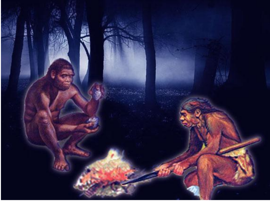
भूतकाळातील शोध आणि तंत्रज्ञान

भूतकाळ आणि भविष्यकाळ : भूतकाळ, वर्तमानकाळ आणि भविष्यकाळ हा आपणास अनेक गोष्टींचा झालेला परिणाम, चालू कृती आणि होणारा परिणाम दाखवून देतो. जसे की, आपल्या भारतावर इंग्रजांचे राज्य होते आणि त्यासाठी आपण स्वातंत्र्यलढा देऊन १५ ऑगस्ट १९४७ रोजी आपला देश स्वतंत्र केला. यात या सर्व गोष्टी भूतकाळातील आहेत. पण या भूतकाळातील गोष्टींचा परिणाम म्हणजेच वर्तमानकाळातील आपले स्वातंत्र्य आहे.